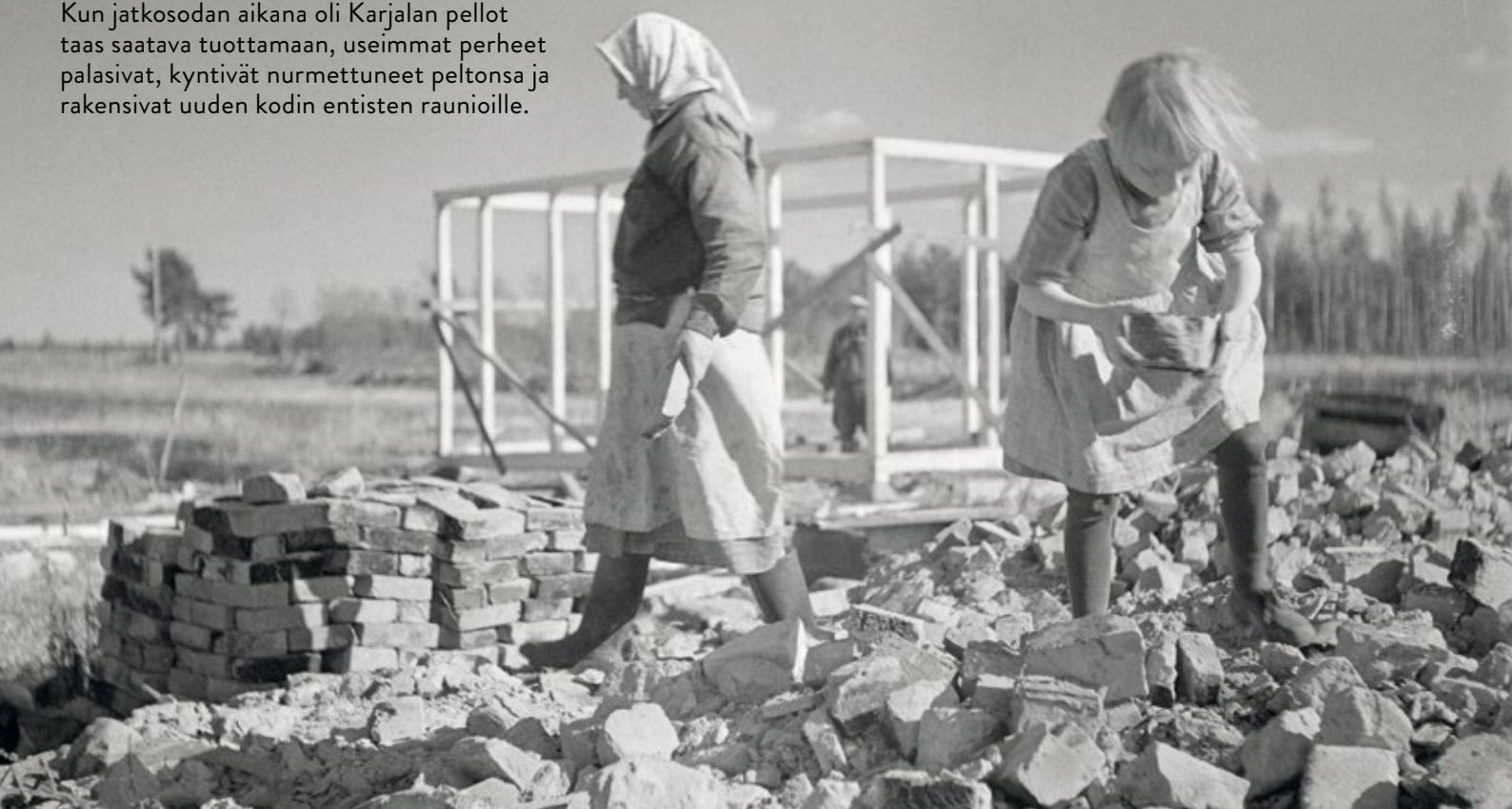
Jälleenrakennusta Kyyrölässä huhtikuussa 1942

Valtaosa karjalaisista menetti kaiken kahdesti. Kun jatkosodan aikana oli Karjalan pellot taas saatava tuottamaan, useimmat perheet palasivat, kyntivät nurmettuneet peltonsa ja rakensivat uuden kodin entisten raunioille.