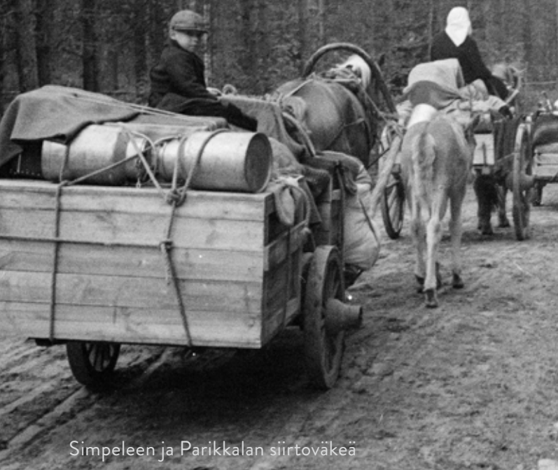
Simpeleen ja Parikkalan siirtoväkeä

Anna sotilasosastoille ja kuormastoille tietä. Kulje tien reunoja. Mikäli voit, vältä päiväsaikaan kulkemasta avoimilla paikoilla ja teillä. - Lääninhallituksen evakuoitinkäskey 1939