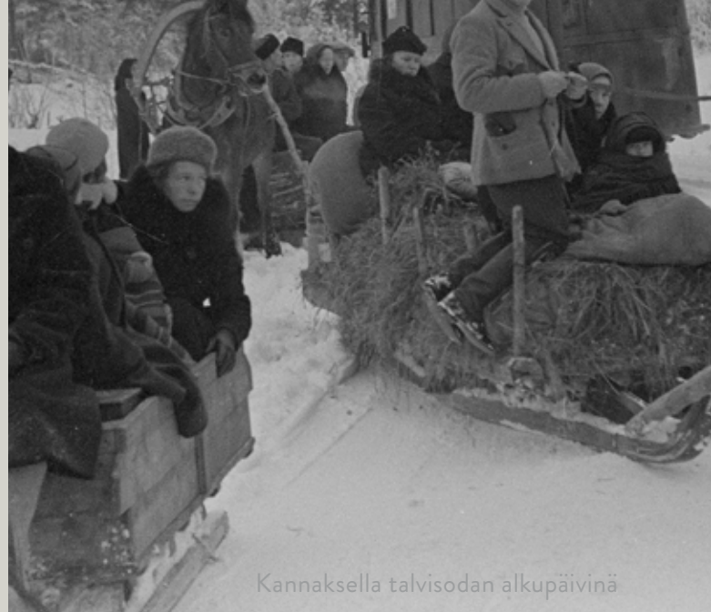
Kannaksella talvisodan alkupäivinä

Muista, että lumivaippa suojaa sinut talvella ja kesällä sulautut helposti maastoon, jos vältät liikkumista lentokoneiden lähellä ollessa. - Lääninhallituksen evakuoitinkäskey 1939